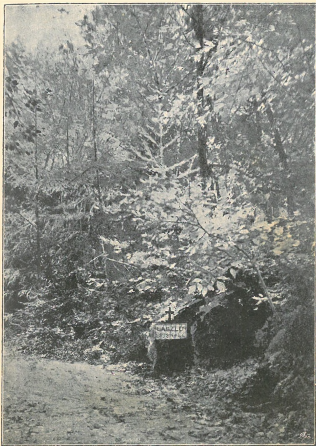
László főherceg kedvelt játékhelye az alsúthi parkban.