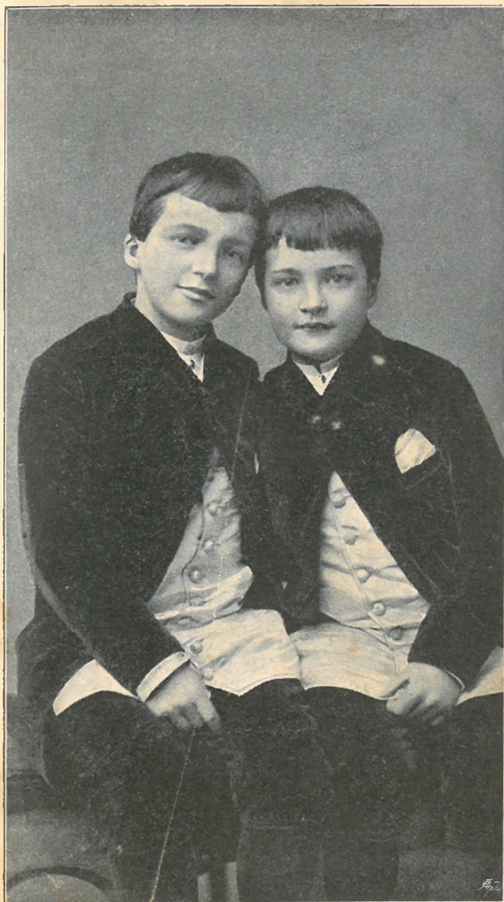
József Ágost és László főherczegek.