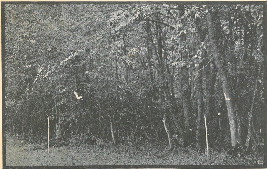
A szerencsétlenség színhelye.