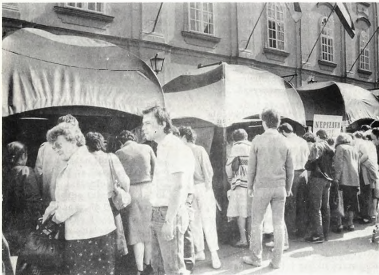
Ünnepi könyvhét 1987 Székesfehérvár, Szabadság tér