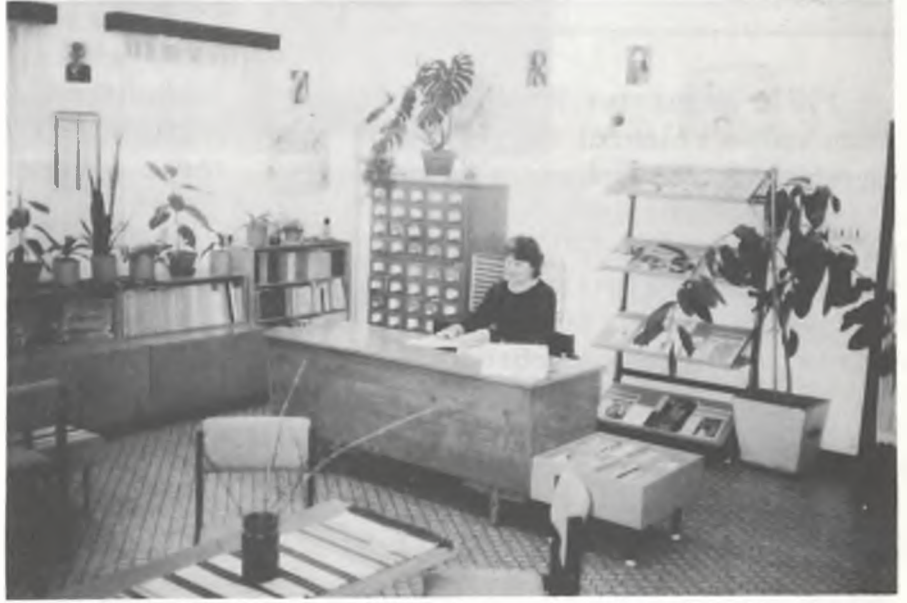
Részletek a seregélyesi könyvtár belső teréből