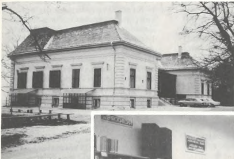
A kastély és a könyvtár