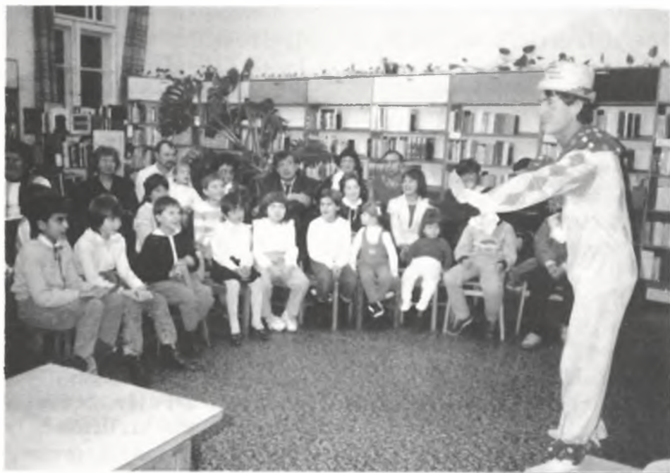
Mikulás-délutáni műsor a megyei könyvtárban