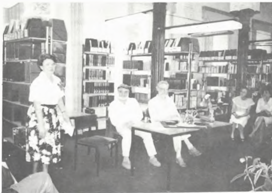
Az UJ IDŐ szerkesztőségi estje a megyei könyvtárban