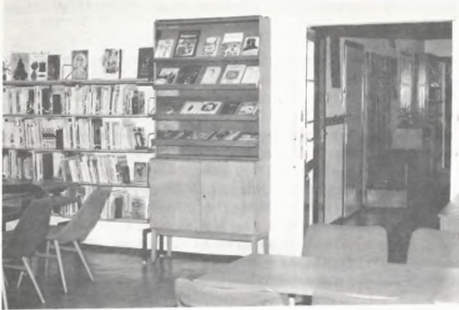
A felújított etyeki könyvtár