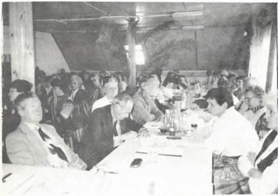
A délutáni tanácskozás résztevői Mezőszentgyörgyön

Ezek a gondolatok jutottak eszembe a mai nap tanulságairól.