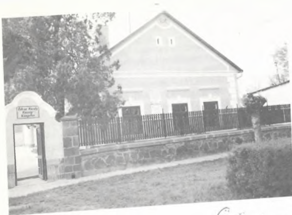
Mezőszentgyörgy, 1989. április 22.

Örömmel állunk ki előtt a Mezőszentgyörgyi és Könyvtárunk Eötvös Könyvtárához, melynek ajándékát