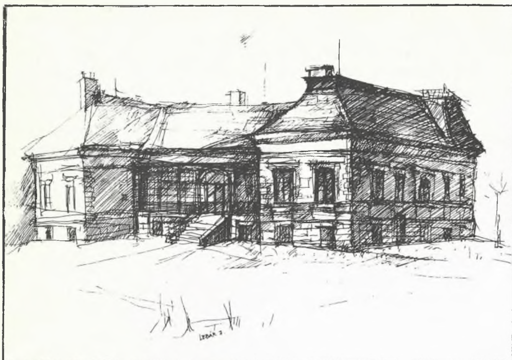
A VELENCEI NAGYKÖZSÉGI KÖNYVTÁR TÁJÉKOZTATÓJA