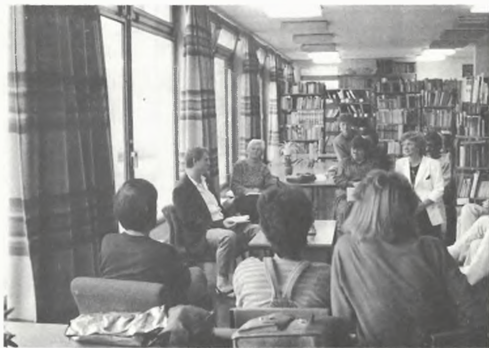
A GÁRDONYI VÁROSI KÖNYVTÁR ÜNNEPI KÖNYVHETI VENDÉGE • CZAKÓ GÁBOR