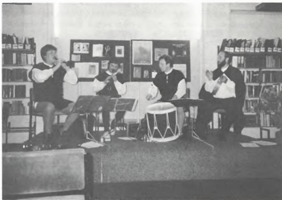
A VAGANTES Együttes a Vörösmarty Mihály Megyei Könyvtárban