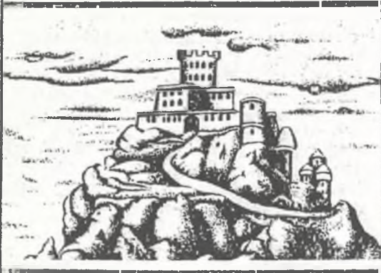
História klub füzetek