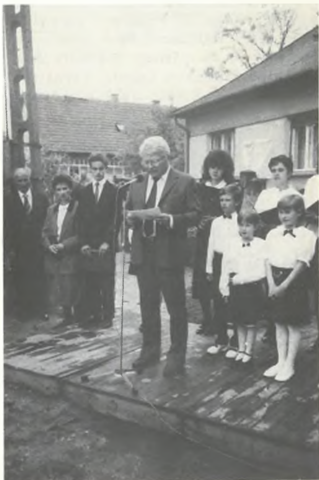
Szabó Gyula színművész

Összegzésül elmondhatjuk: az idei könyvhéten bőségesen volt rendezvény, kiállítás, többségének népes közönsége. Volt minden rendezvé-