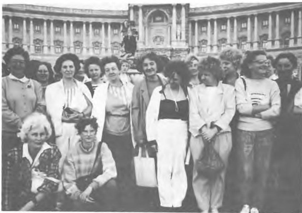
A könyvtárosok egy csoportja Bécsben