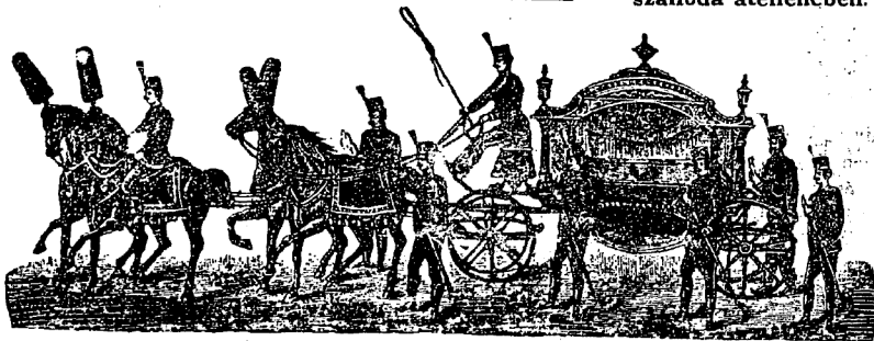
Vidéki megrendelések távirat útján is elfogadjatnak.

Hullák szállítása a vidék bármely irányába eszközöltetnek.