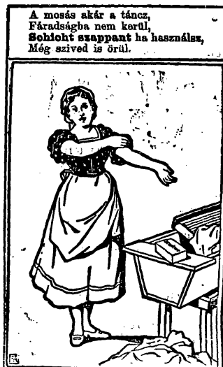
A mosás akár a tánc, Fáradságba nem kerül, Sohozt szappant ha használ, Még szived is örül.

Bicske, Bodejk. A postán lesz a tévedés. Mi rendesen küldjük.