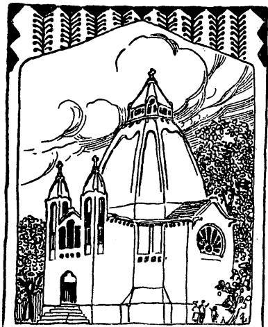
A Jézus Szive templom