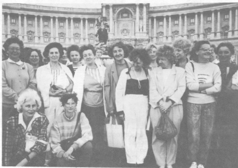
A könyvtárosok egy csoportja Bécsben